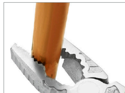
Zone de préhension pour les matériaux ronds.