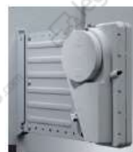
Adaptateur pour fixation murale.

Montage mural en série : commandez 2 fixations murales pour le premier tube de penderie + 1 fixation murale pour chaque tube supplémentaire.